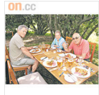
午餐都在戶外進行，營友圍埋用餐，順道交流Safari所見。