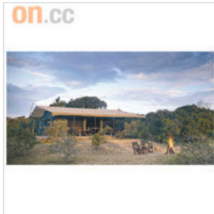
Porini Rhino Camp 屬小型的Lodge，只有12個宿位，每兩人一個獨立營帳。

每年7月開始，舉世聞名的動物大遷徙展開，數百萬隻水牛、斑馬及大象等動物便從坦桑尼亞橫越到肯尼亞西南部……然而我等不及，趁人少少，率先飛到肯尼亞中部的OL Pejeta自然保護區，體驗野外獵奇的滋味；這保護區名氣雖不及旅遊熱點瑪莎瑪拉國家公園大，卻有齊非洲五大動物獅子、大象、犀牛、豹及水牛，算很不錯。