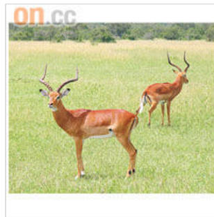
有角的黑斑羚是公，一公等閒拖幾十隻雌做老婆。