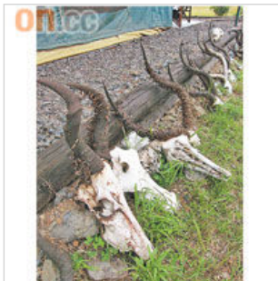
營前地上擺滿營主拾回來的動物骸骨，當中連獅子都有。

我們所住的營地Porini Rhino Camp只有12個宿位，環境清幽，不會人頭湧湧掃雅興，更難得是這裏三餐有大廚「煮」理，水準絕不遜於酒店。晚上營主多次問我：「你幾點沖涼？」原來這裏有專人煲熱水，到時到候會倒入你營內的水缸，一開花灑就有熱水淋浴。睡床就更軟綿舒服得沒話可說，揭開被單，還發現有暖水袋（原野晚上可非常冷），雖身在野外，鳥獸近在咫尺，如此貼心服務令人甚有安全感。