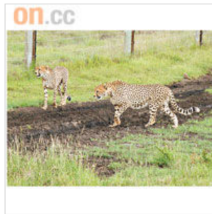
獵豹亦是瀕危動物，多在日間活動，不太怕人。

據知區內有 45 隻獅子，可惜沿途始終碰不到，反而碰上剛被獅子宰殺了的長頸鹿，可憐的屍體給兇手飽餐一頓後，又輪到禿鷹群來「食尾圍」，弱肉強食的殘酷，這裏看得一清二楚。還是活生生的長頸鹿可愛多，牠們與斑馬都是橫過我們車前的常客，還有常見一拖幾十隻老婆出巡的黑斑羚；但最心慌還是見到獵豹，施施然在我 10 呎前行過，感覺像大貓多過像兇猛的殺戮機器。