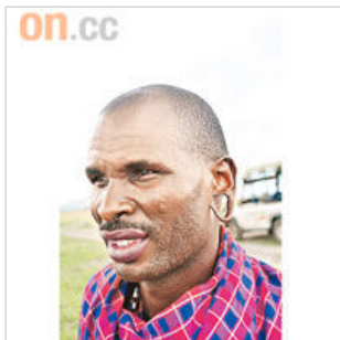
瑪莎族人到 20 歲便要行成人禮，在臉上灼上圖案，並用刀在耳上開大洞。

Safari 活動至太陽下山仍在進行，導遊拿着大光燈在車上照動物，無奈天下着雨，晚間 Safari 得取消。不過不用失望，因為第二天突然來了幾個土著，在營地等我們出發，準備一同到荒野獵奇。