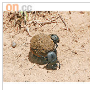
甲蟲會在「滾球」中生蛋，滾球就將是幼蟲的食糧。

他們是瑪莎族土著，原居於瑪莎瑪拉地區一帶，雖然他們一身土著衫，也不諳英語，卻很「文明」，他們說在家鄉用樹枝、牛屎及泥堆砌成的牛屎屋，早已成為遊客的參觀點。來到這裏，目的是陪旅客到荒野漫步賺些外快，但真的只是陪行，全程由導遊講解土著文化，不過土著們相當友善，任影唔騷之餘還永遠笑笑口，跟我印象中土人的野蠻形象完全不同。不問不知，原來我們其中一位司機也是瑪莎族人，他有幸入學讀英語，可以選擇更「文明」的生活，果然是書中自有黃金屋。