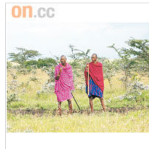
瑪莎族土著老遠從瑪莎瑪拉地區到來，陪伴遊客到原野漫步。